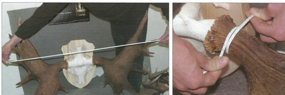
Joonis 1. Sarvede laiuse ja sarve tüviku ümbermõõdu mõõtmine (allikas: Roht. K. Jahitrofeede hindamine. Tallinn. 2006. leheküljelt 23)

Tüvikute ümbermõõt – mõõdetakse tüvikute kõige peenemast kohast, kuid mitte kaugemalt kui 6 cm sarve kännasest. Mõõt esitatakse võimalusel millimeetritäpsusega (joonis 1).